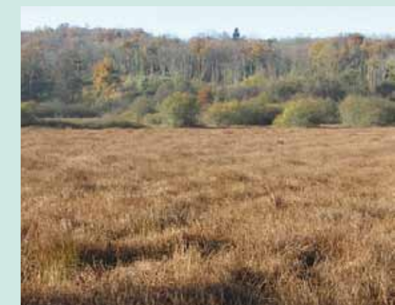
A noter que ce marais est sur le territoire de la commune de Novalaise

sont menées depuis quelques années par Patrimoine Sauvage, aidé aujourd'hui par la FAPLA (Fédération des Associations de Protection du Lac d'Aiguebelette), le relais local du Conservatoire des espaces naturels. C'est ainsi qu'après un temps de réflexion, un accord fut conclu entre les deux parties et se solda par la vente définitive du marais de Michel permettant qu'il rejoigne les sites gérés par le conservatoire. Plus qu'une vente, une transmission de patrimoine !